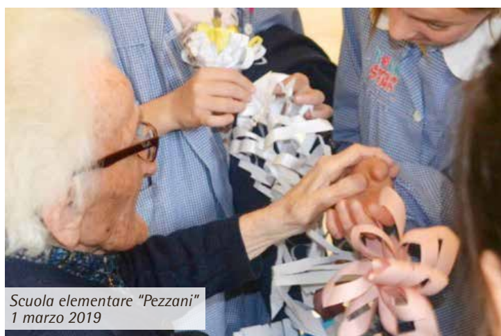
Scuola elementare "Pezzani" 1 marzo 2019