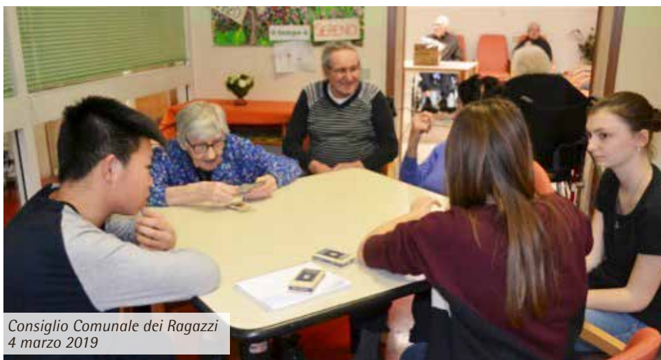
Consiglio Comunale dei Ragazzi 4 marzo 2019

Gli incontri sono stati coinvolgenti e positivi non solo per gli anziani, anche per i ragazzi ed i loro insegnanti, tanto che nell'anno scolastico 2018-2019 il progetto "Anziani e bambini.. insieme si cresce e ci si diverte" è stato inserito nel progetto didattico della "Pezzani" e così -con l'arrivo del carnevale - sono ripresi gli incontri. Il 1° Marzo la 4°B ha partecipato ad un labora-