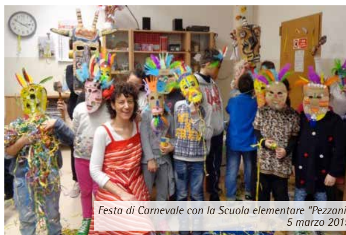
Festa di Carnevale con la Scuola elementare "Pezzani" 5 marzo 2019